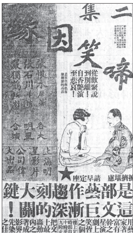
圖3 《啼笑因緣》(《申報》，1932年9月25日)

以上三個案例顯示民國時期文藝電影和文學作品的相互關係，而這個關係直接影響到影片的行銷與消費。基於此，從電影類型的角度分析，我們可初步作一個假設：從劇本的來源，和對觀眾可能造成的訴求來看，文藝片在民國成立的第二十年中，儼然已成為一個可操作的電影類型。